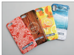
側面までキレイに印刷