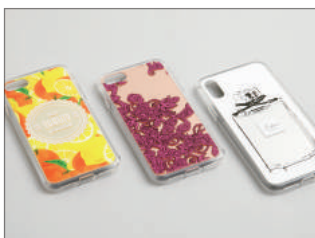
安全素材で自撮り世代に人気