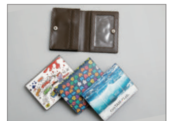
PULレザー仕様のマストアイテム