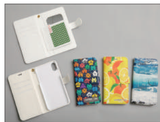
高級感あるPULレザー仕様