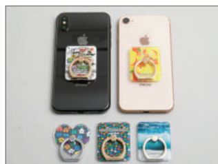
落下防止に役立つスマホアイテム