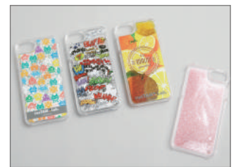
ラム&クリア仕様でiPhoneとの相性◎