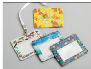
フルカラー印刷でお洒落に変身